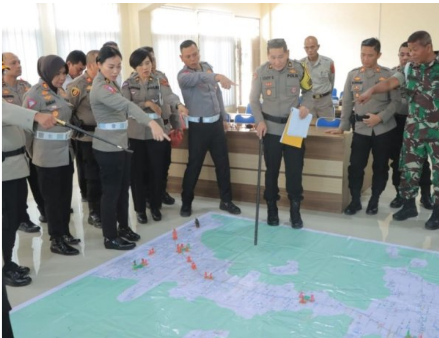
Tactical Floor Game Pengamanan PON XXI Aceh-Sumut, dilaksanakan Polres Tanah Karo, Senin (26/08-2024)

KARO - Untuk melakukan pengamanan disatu acara yang bertaraf nasional, tentunya tidaklah gampang. Segala bentuk persiapan harus disiapkan secara