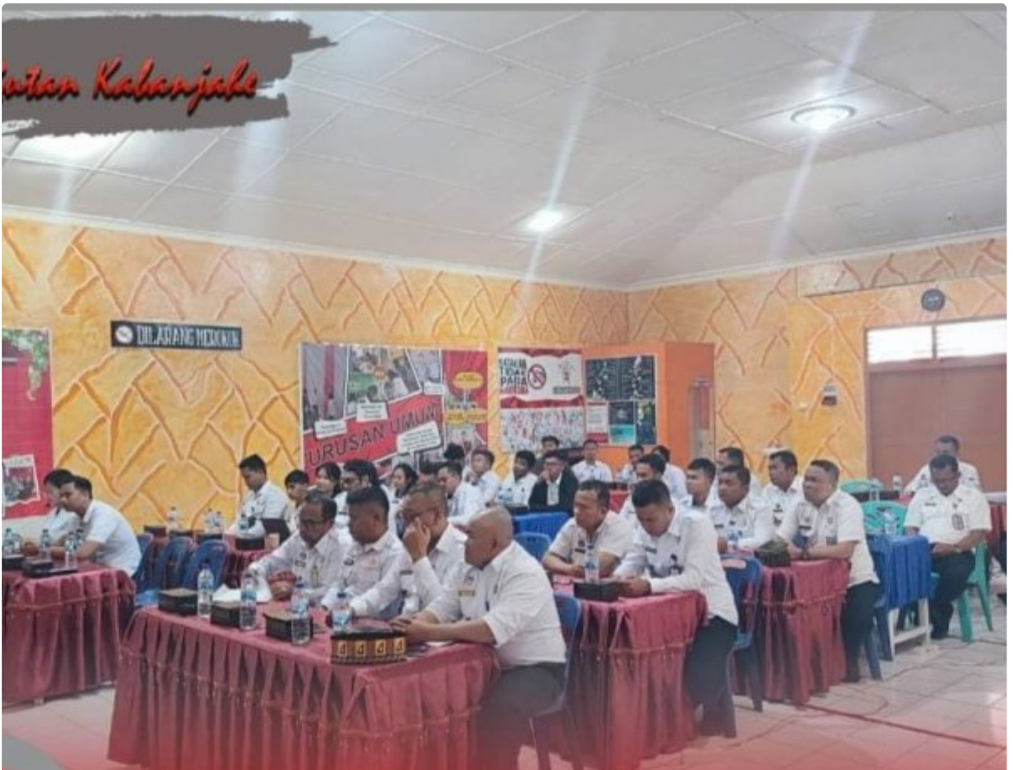
Rutan Kabanjahe Ikut Bimtek LKjIP di Lapas Siborong-borong, Senin (11/09-2024)