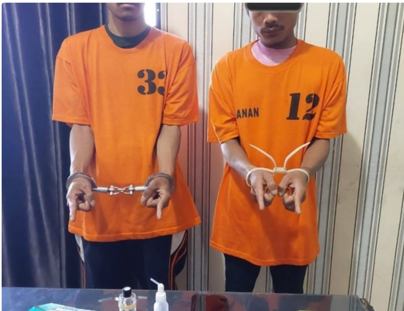
TSK dan Barang Bukti yang disita Satres Narkoba Polres Tanah Karo

KARO - Benar-benar menakjubkan, kerja keras Satres Narkoba Polres Tanah Karo untuk memberantas peredaran atau penyalahgunaan narkoba di 'Bumi