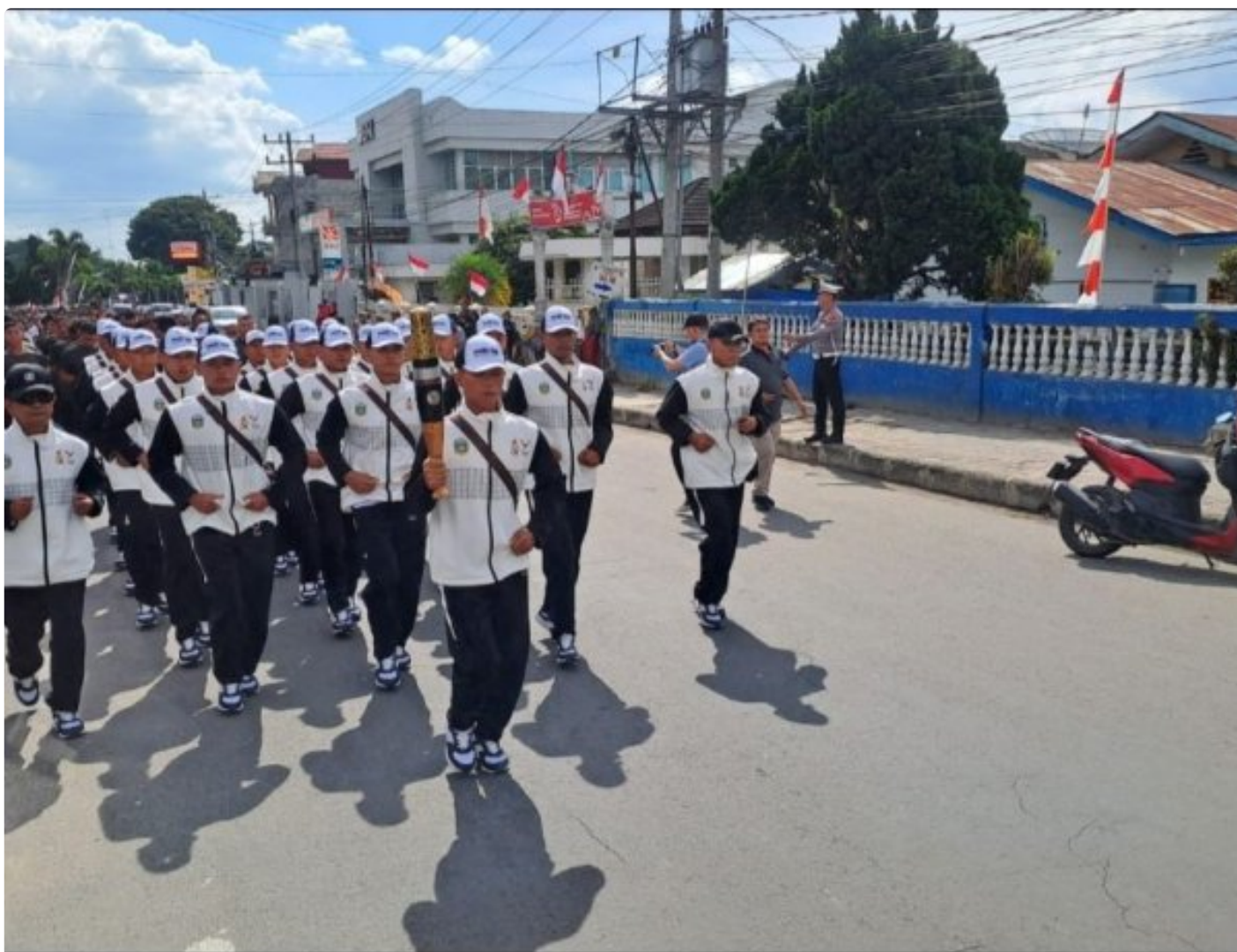
Kirab Api Pekan Olahraga Nasional (PON) XXI Aceh-Sumut, Singgah di Kabupaten Karo, Minggu (01/09-2024)

KARO - Kirab api Pekan Olahraga Nasional (PON) XXI Aceh-Sumut 2024, yang resmi lebih dulu diarak Selasa 27 Agustus dari Tugu Sabang Merauke, Kota